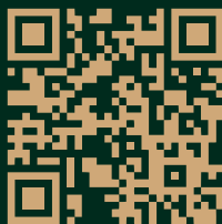
Лето в Тобольске 2024

Тобольск — это настоящий музей под открытым небом, практически каждое здание здесь представляет историческую ценность. Город активно развивается как центр событийного туризма региона. Богатая история, бесценное многовековое культурное и природное наследие города, современное социально-экономическое развитие Тобольска, делают его одним из самых живописных и привлекательных городов не только Сибири, но и России в целом.